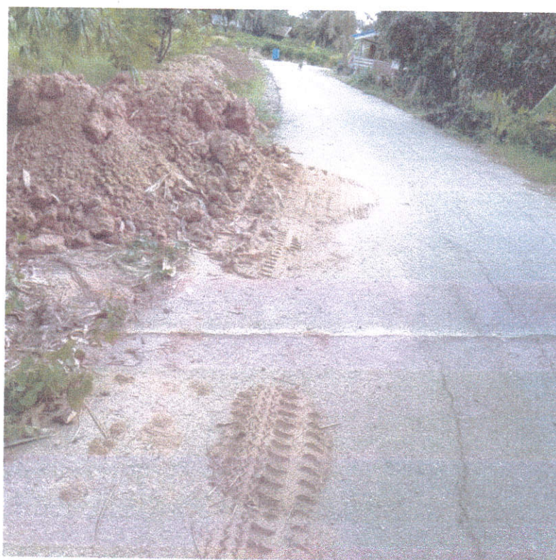
รถสวนทางก็ต้องป็นขึ้นไปบนกองดิน