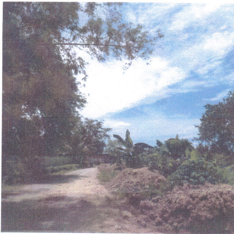
ลำมากองบนถนน สวนทางลำบาก สกปรก