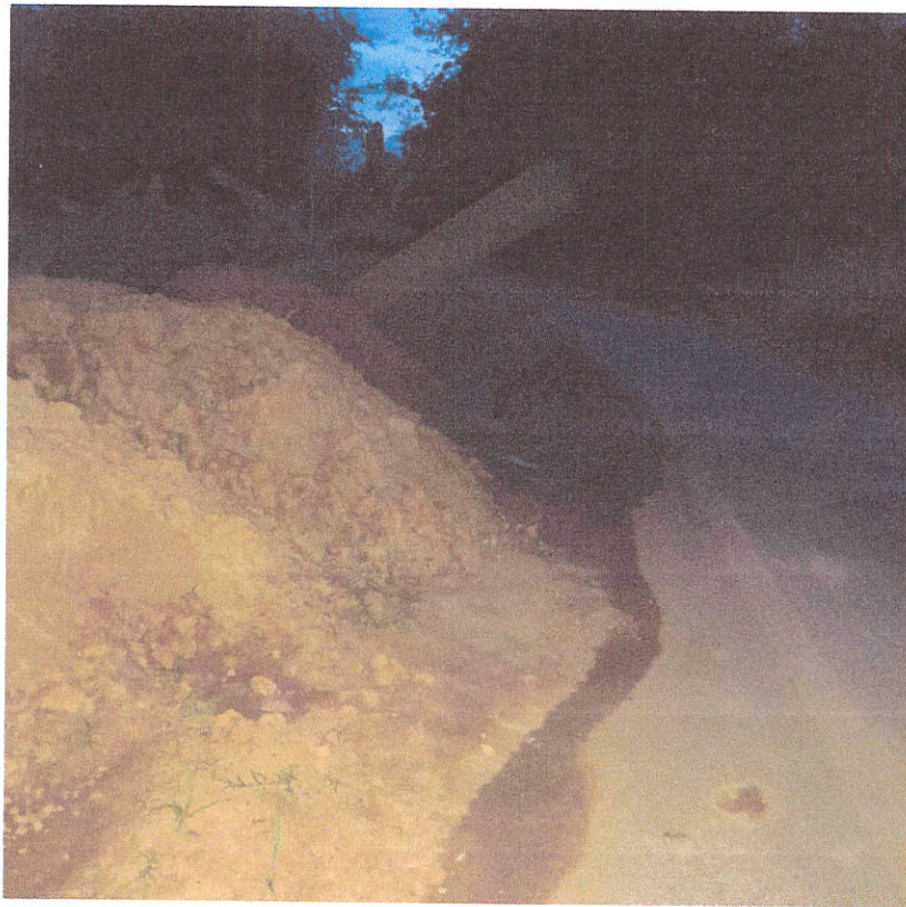
เวลาฝนตก น้ำขัง เนื่องจากดินปิดกั้นหมด น้ำไหลลงไหล่ทางหรือคลองไม่ได้